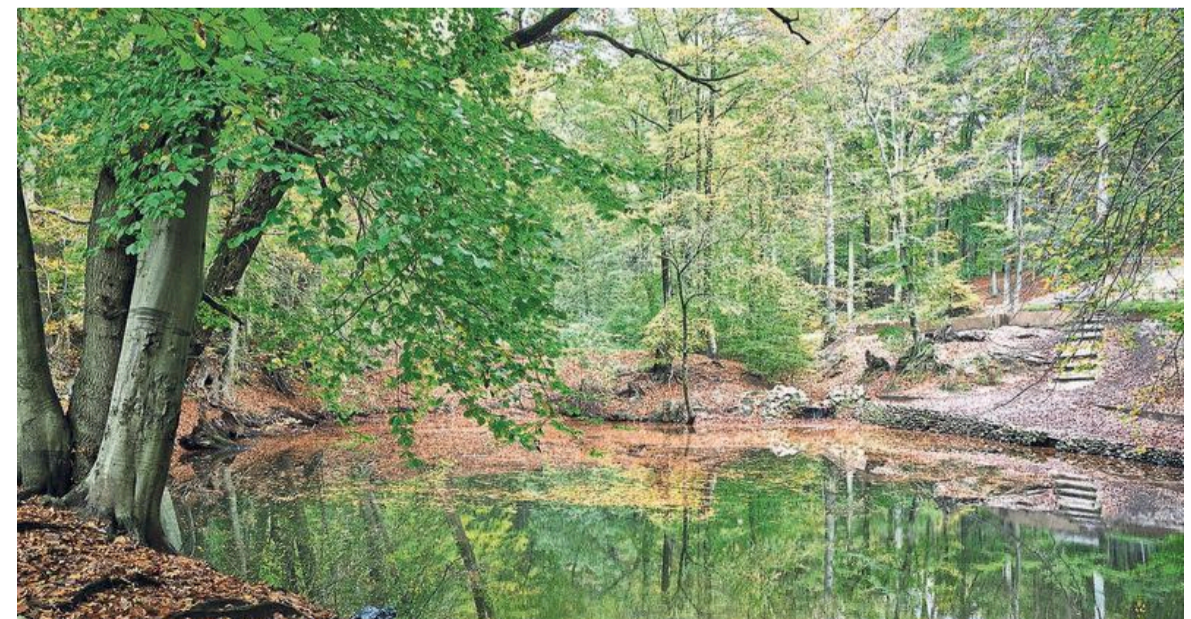
Kraakheldere beken en mooie venetjes in het bijna verkleurde bos.