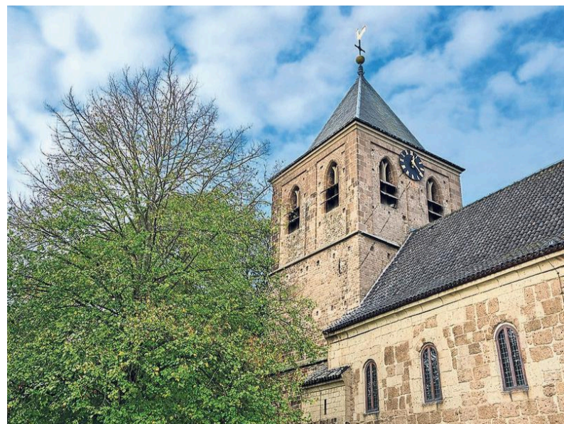
De Oude Kerk in Oosterbeek werd door de geallieerden gebruikt als uitkijkpost. In de eeuwenoude muren zie je nog altijd de littekens van de beschietingen.

indrukkelijke Airborne begraaftplaats waar honderden jonge mannen liggen begraven die bij de operatie Market Garden omkwamen. Ze hadden het verdiend als de prachtige wandeling niet Rosandepad maar Airbornepad was genoemd.