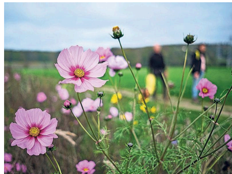
De klompenpaden gaan door bossen, over boerenerven, maar ook door bermen met bloemenstroken zoals hier.